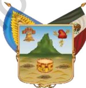
Estado Libre y Soberano de Hidalgo